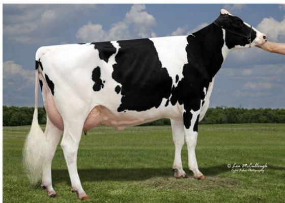
SYNERGY UNO POT O GOLD FOURTH DAM